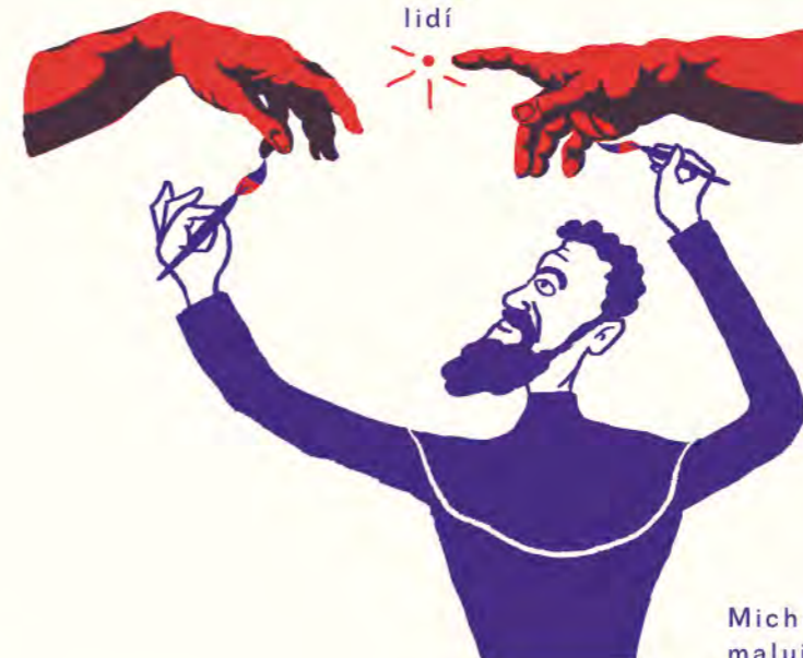
Michelangelo Buonarroti maluje Sixtinskou kapli.