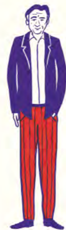
Robert de Niro